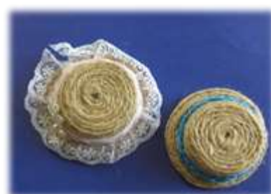
⑧ ペットボトルキャップマグネット