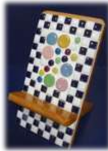
② 携帯電話、ゲーム機スタンド