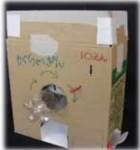
① ガチャポンマシン

万が一定員をオーバーした場合は、抽選の上決めさせていただきますので、ご了承ください。