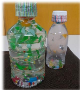
ペットボトルで キラキラボトル