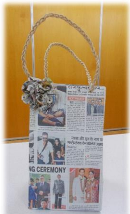
新聞紙エコバッグ作り