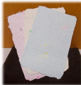
牛乳パックで 紙漉はがき作り