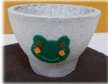
紙ごみを使ったエコポット作り