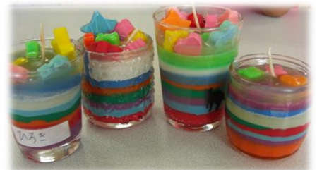
廃食油でキャンドル作り