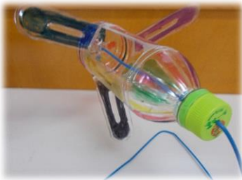
ペットボトルを使った風車作り