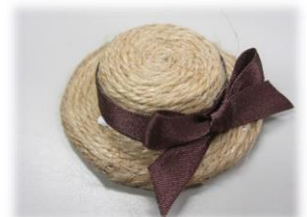
ペットボトルキャップで マグネット作り