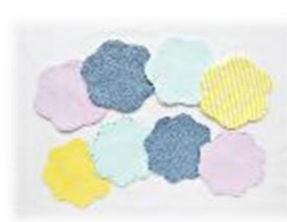
「母の日」お花のコースター作り