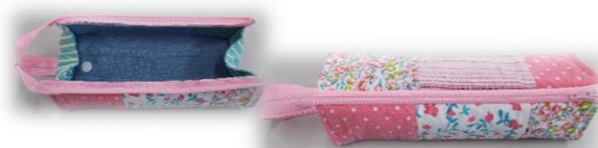
② トレータイプのパンケース作り