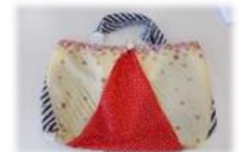
④ 傘布エコバッグ作り