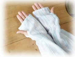
① 日焼け止め防止腕カバー作り