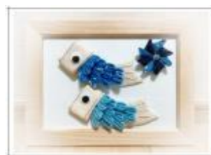
「子供の日」こいのぼりフレーム作り